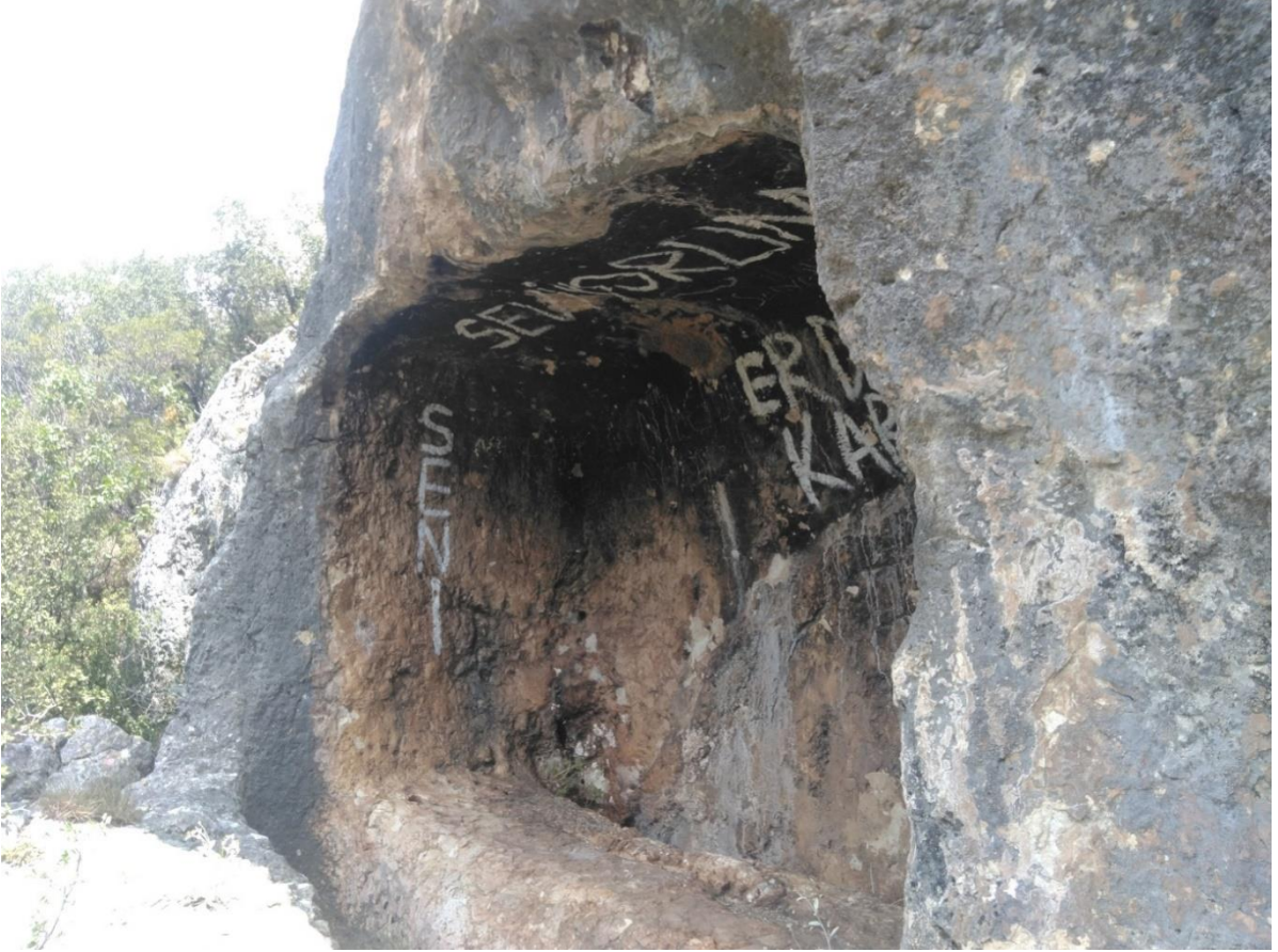
Fotoğraf 3: Kale Mevkii 1 Nolu Kaya Mezarı