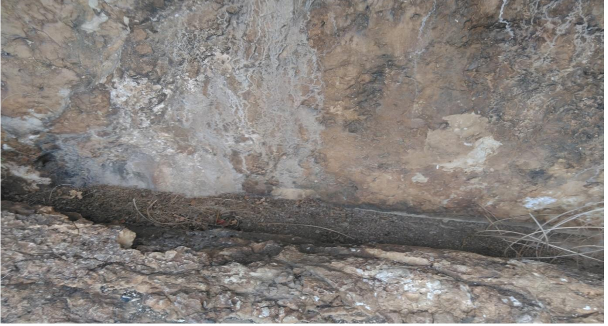
Fotoğraf 4: Kale Mevkii 1 Nolu Kaya Mezarı İç Gümü Alanı?