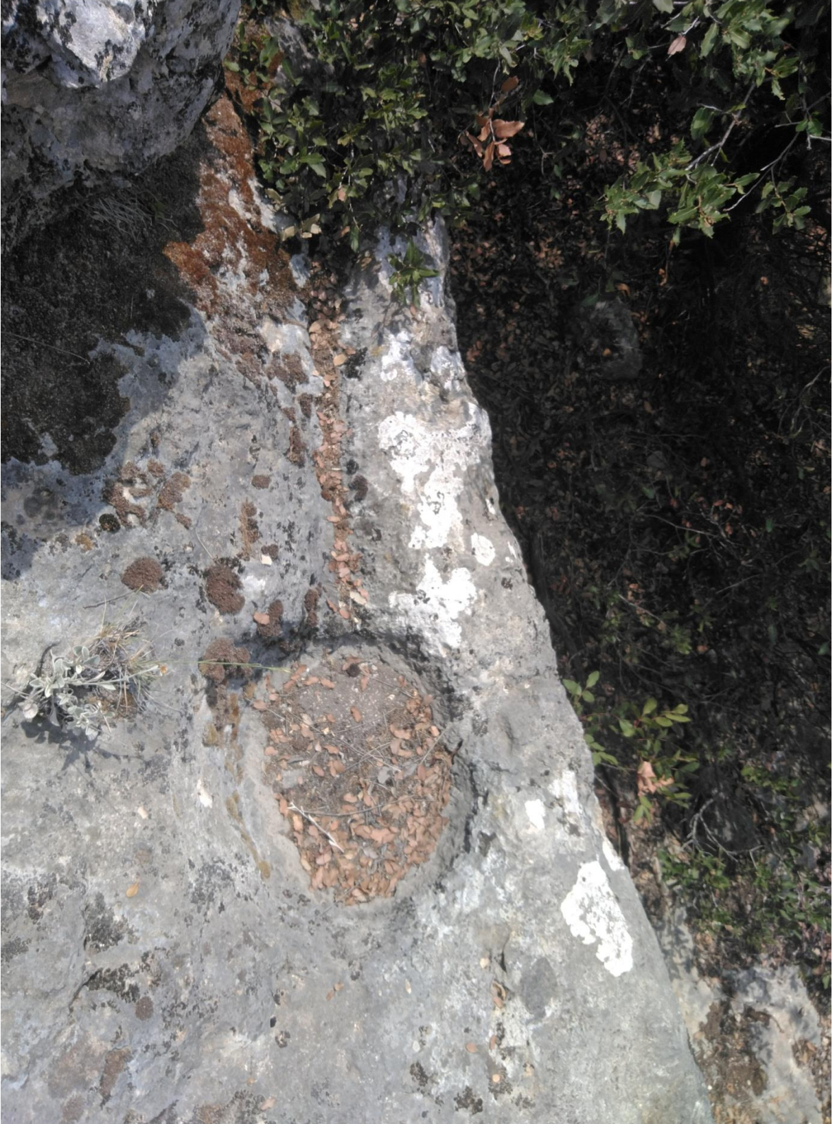
Fotoğraf 11: Mezarın Yanında Bulunan Kaya Çanağı ve Libasyon Amaçlı Oyuklar (Harun Kurt)