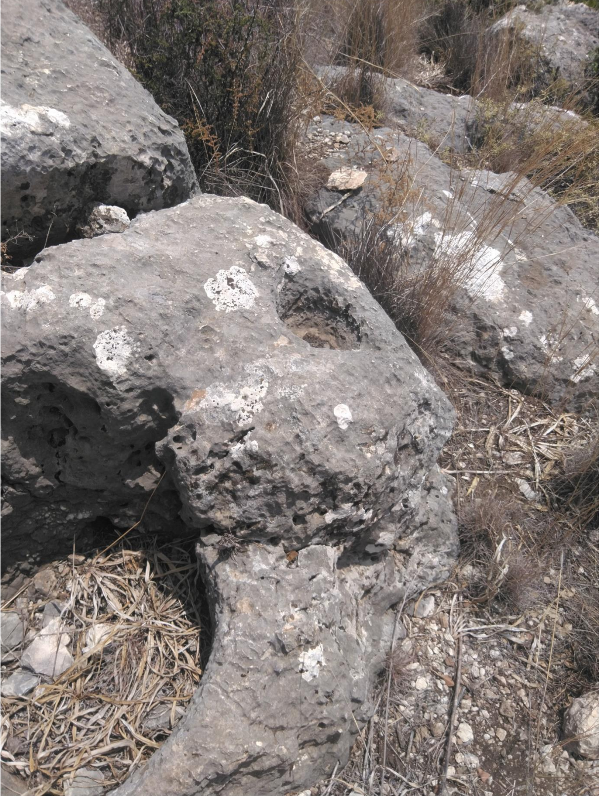
Fotoğraf 7: 1 Nolu Mezarın Civarındaki Kaya Çanakları