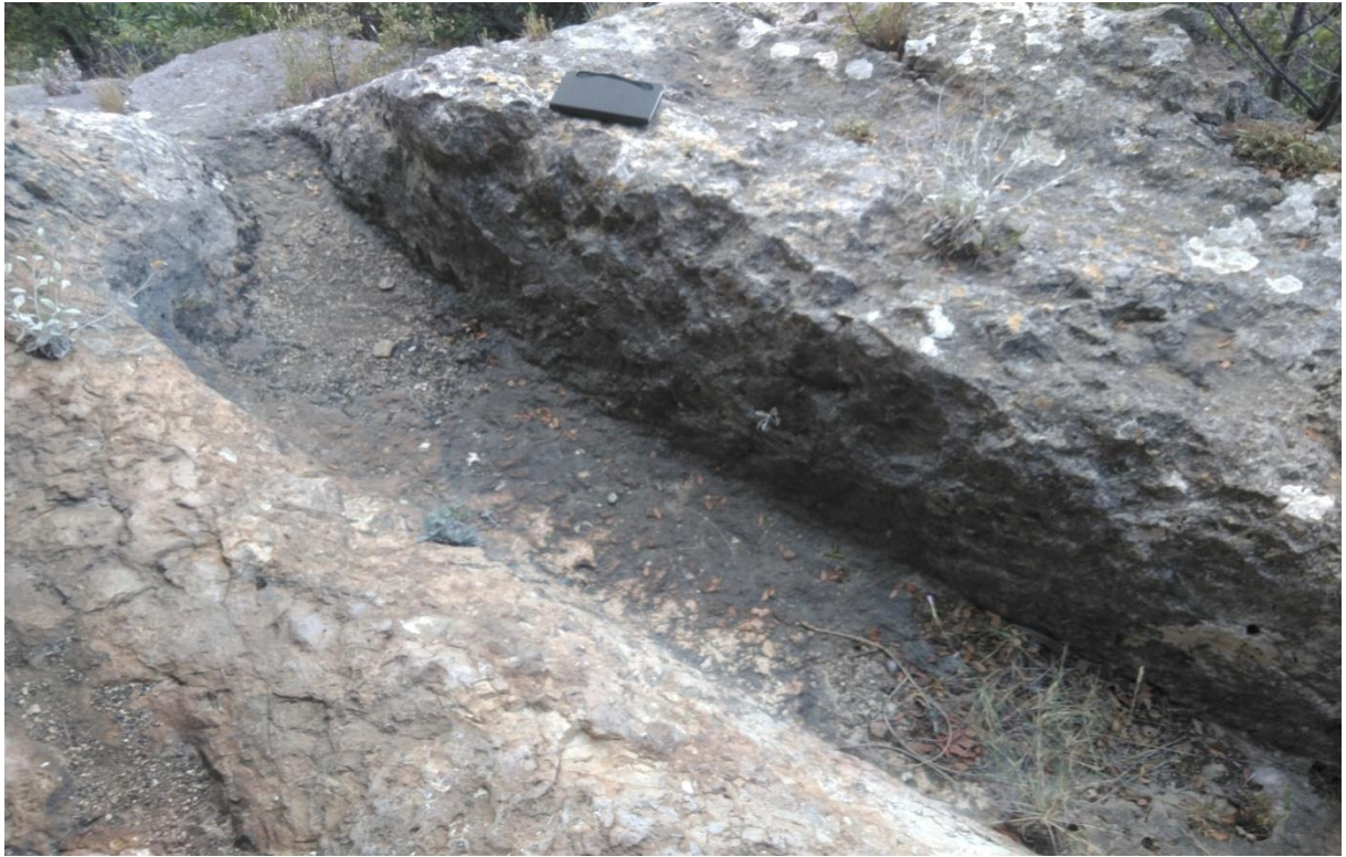
Fotoğraf 5: Kale Mevkii 1 Nolu Kaya Mezarı Dış Gümü Alanı? (Harun Kurt Kişisel Arşivi)