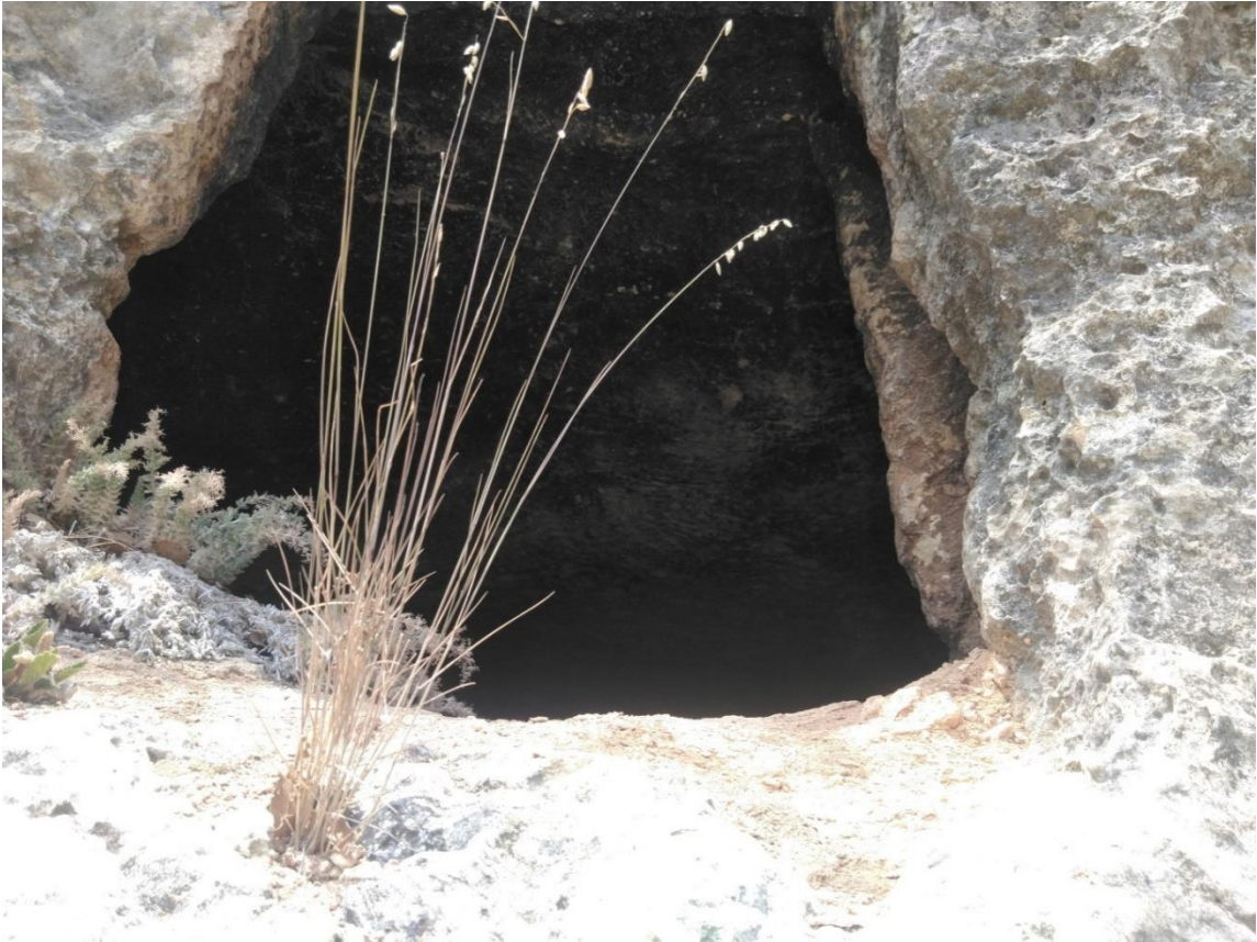
Fotoğraf 2: Oğlak Kayası Kaya Mezarı İçi (Harun Kurt Kişisel Arşivi)