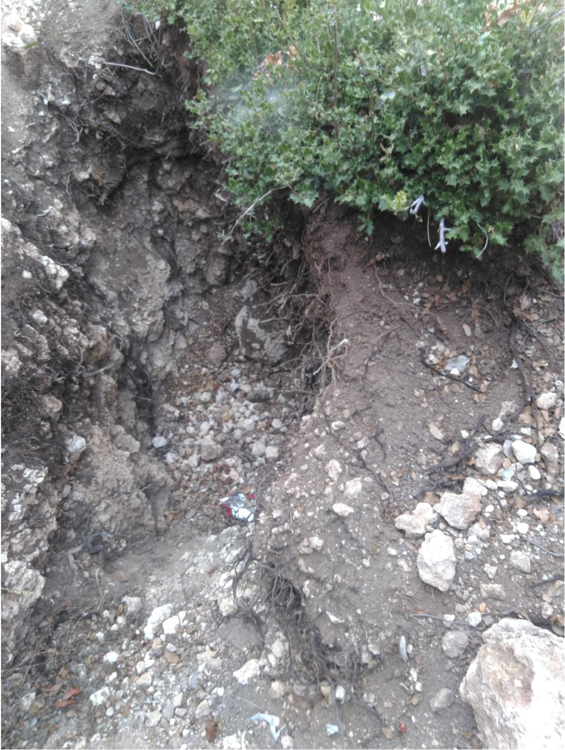
Fotoğraf 13: Gedik Harman Kaya Mezarı Önünde Kaçakçılar Tarafından Açılmış Çukurlar