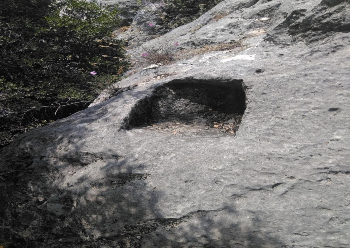
Fotoğraf 6: 1 Nolu Mezarın Etrafındaki Yontulardan Biri