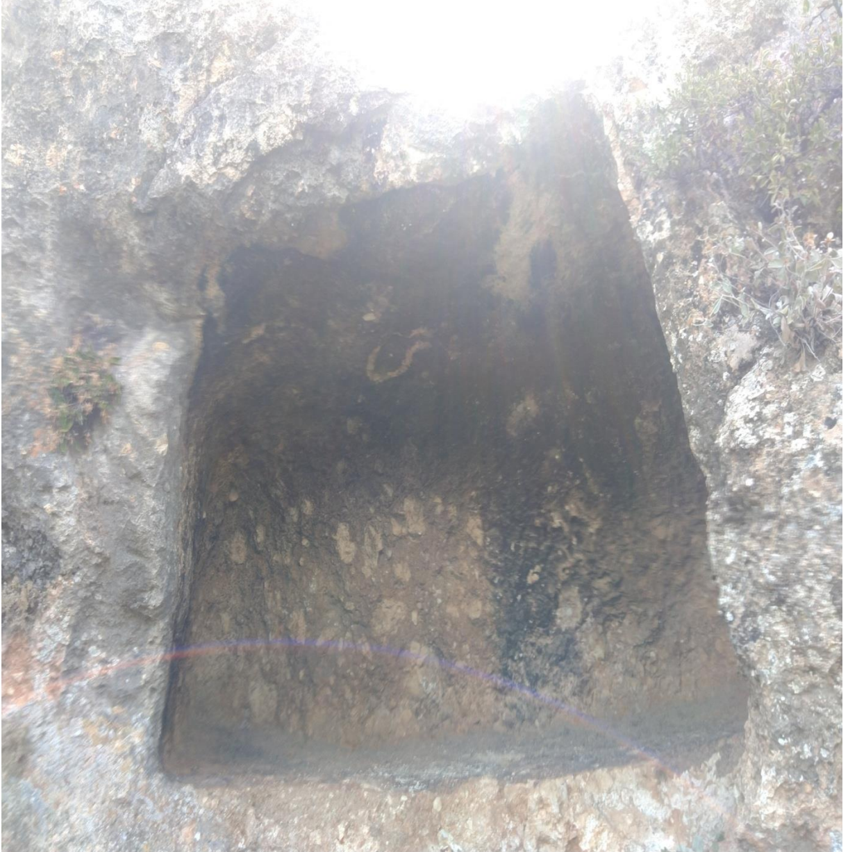
Fotoğraf 12: Gedik Harman Kaya Mezarım

Kale mevkiine oldukça yakın bir konumda bulunmaktadır. Rakımı 690 m dolayındadır. Dikdörtgen bir formda hazırlanmıştır (Fotoğraf 12). Koordinatları, 36.732504 kuzey, 34.184514 doğudur. Eni 140 cm, boyu 152 cm, derinliği 100 cm olarak ölçülmüştür. Yoğun tahribata uğradığı dikkat çekmektedir. Herhangi bir kline ya da gömü alanı gözlenmemiştir. Varsa da tahrip edildiğini düşündüren murç izleri dikkat çekmiştir. Halen kaçak kazı tahribatlarının devam ettiğini gösteren emareler etrafta mevcuttur (Fotoğraf 13). Bir yazıt veya işaret gözlenmemiştir.