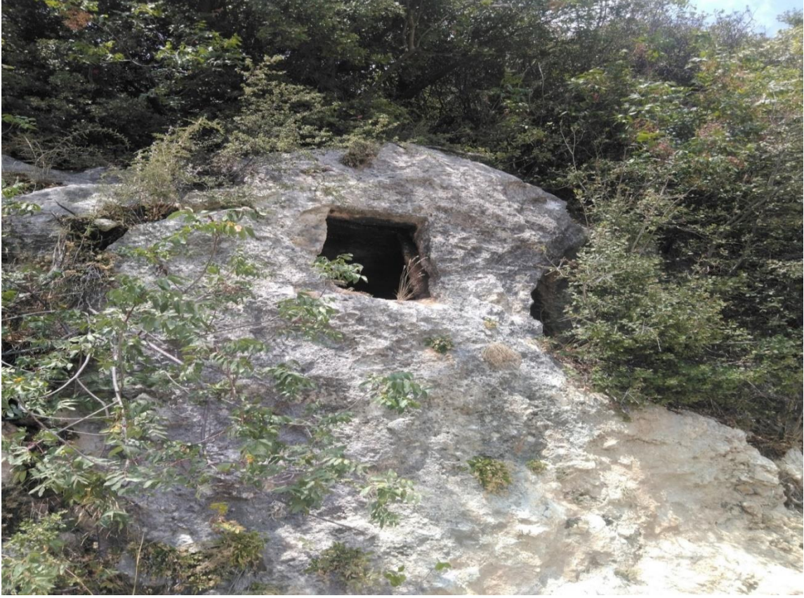
Fotoğraf 1: Oğlak Kayası Kaya Mezarı Girişi