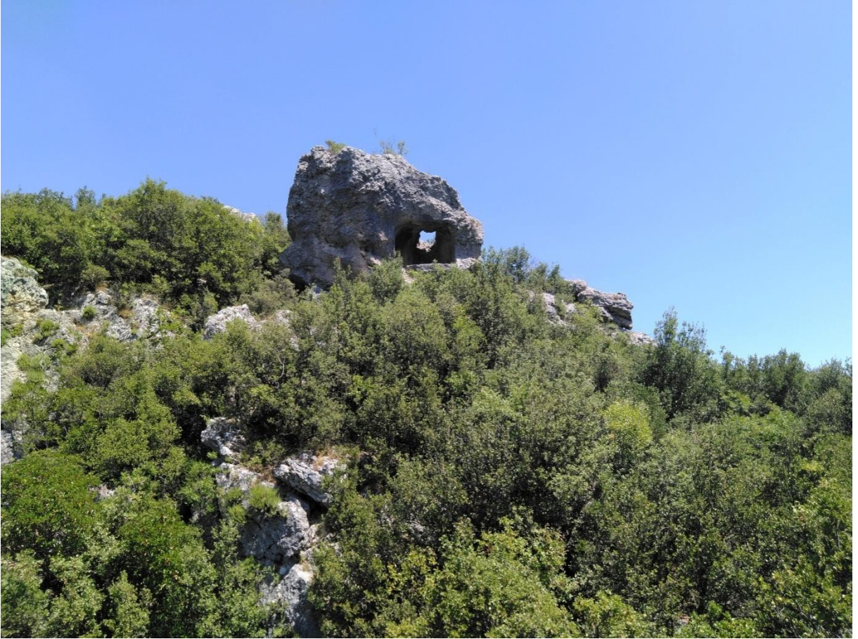
Fotoğraf 8: Kale Mevkii 2 Nolu Kaya Mezarı

1Nolu mezara form olarak benzetmekle birlikte ondan daha küçüktür. Yontu alanı içerisinde herhangi bir tahribat gözlenmemiştir. Ama Arka kısımdan mezara giriş için bir oyuk açılarak bir tahribat yapılmıştır. Yapı içerisinde herhangi bir kline veya gömü alanı da gözlenmemiştir. Dolayısıyla burasının kült heykeli konulabilecek büyük bir niş olabileceği ile ilgili bizde tereddüt oluşmuştur. Ama yine de diğerleriyle form olarak benzemesi dolayısıyla kaya mezarı olarak çalışmada adlandırılmıştır (Fotoğraf 8). Rakımı 680 m dolayındadır. Dikdörtgen bir formdadır. Eni 180 cm, boyu 195 cm, derinliği 140 cm olarak ölçülmüştür. Koordinatları 36.732309 kuzey, 34.185501 doğudur. Zemini tamamen düz ve yontusundaki özen, buranın farklı amaçlarla da (Tapınak) kullanıldığı fikrini uyandırmıştır. Ama dış kısmından bir delik açılarak tahrip edilmiştir. Bölgede yoğun makiler olduğu için yeterli bir inceleme yapılamamıştır.