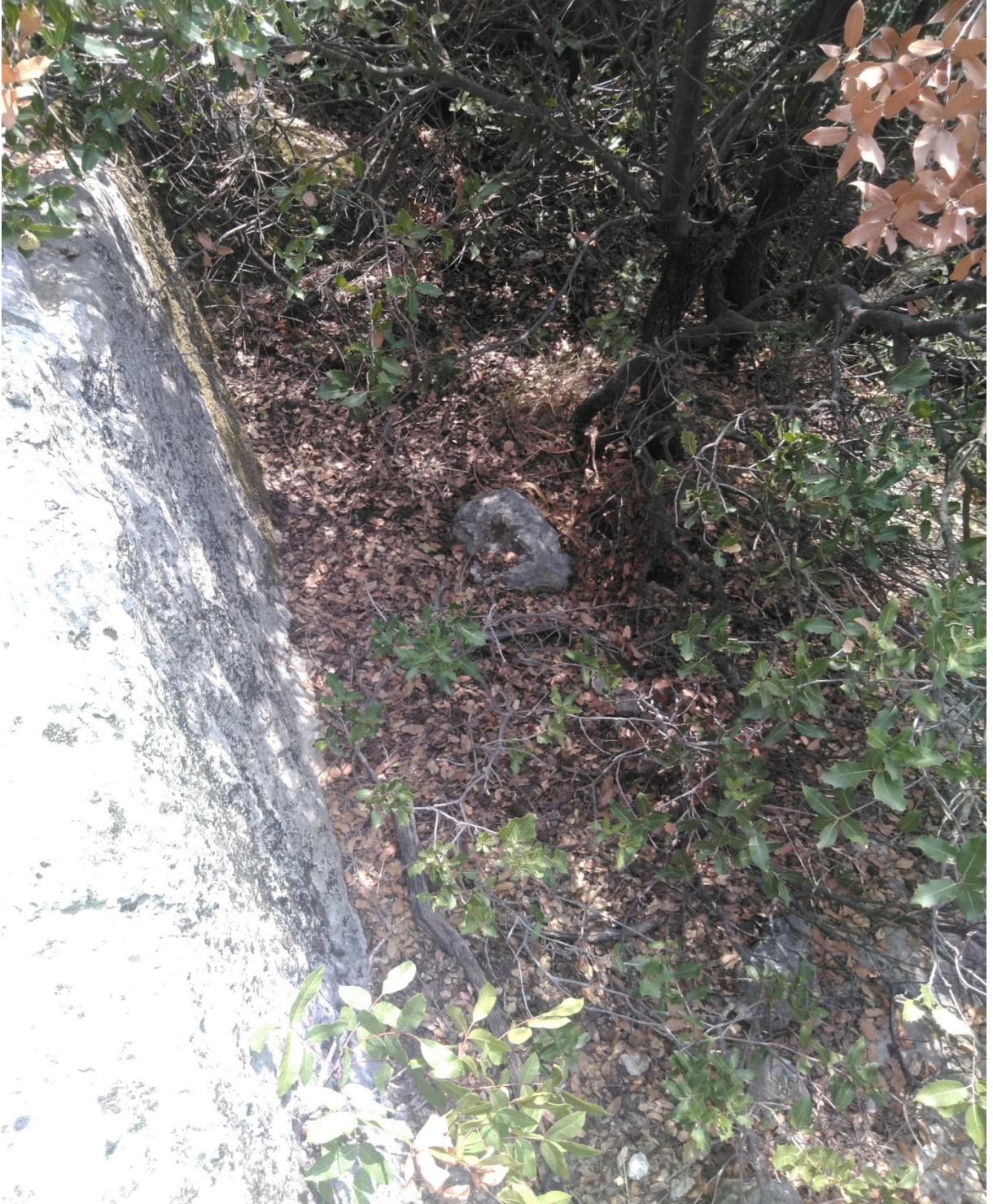
Fotoğraf 10: Kaya Zemine Oyulmuş Mezar

tahribattan dolayı ölçülememiş, sağlam kalan bölüm 30 cm olarak gözlenmiştir. Mezarın üstünde bir kaya çanağı bulunmaktadır. Bu kaya çanağına sağ ve solundan oluklar birleşmektedir. Bu bize benzerlerini Olba'da gördüğümüz libasyon amaçlı oyukları hatırlatmaktadır (Fotoğraf11).